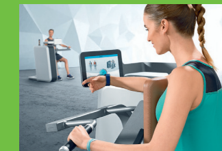
zeitlich strukturierter Gerätewechsel ohne Wartezeiten