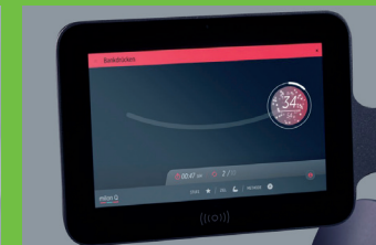
Multifunktions-Display mit Herzfrequenzanzeige