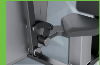
Elektronischer Widerstand statt Metallgewichte